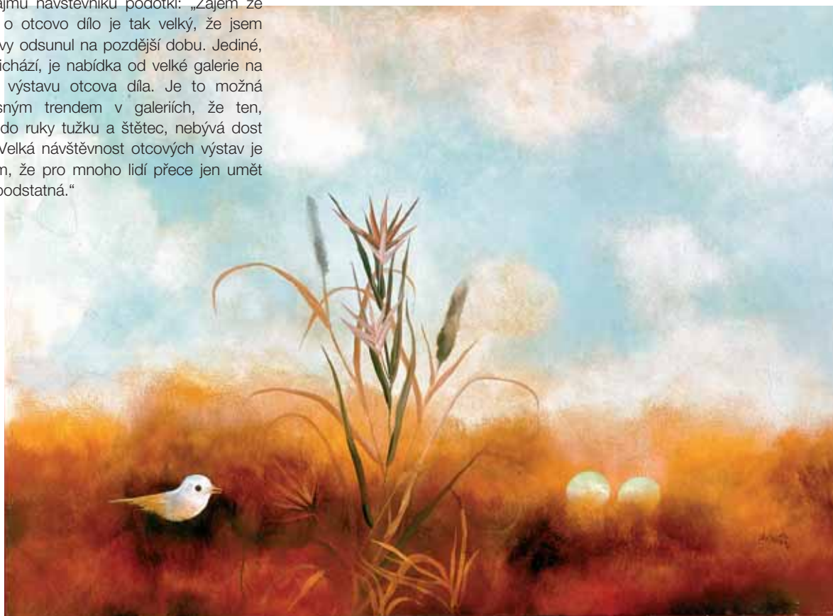
Výstava ve Velké galerii je otevřena do 19. března 2006 Galerie Chodovské tvrze, Ledvínova 9, Praha 4