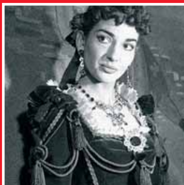
Turek v Itálii – Fiorilla